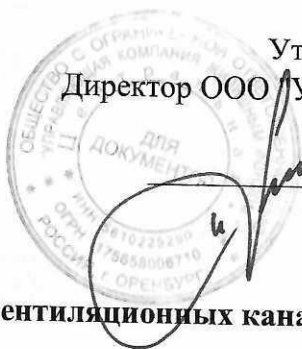
График проверки состояния дымовых и вентиляционных каналов с 01.01.2022 г